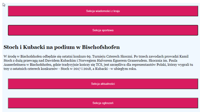
Obraz 3a. Otwarty artykuł sekcji sportowej