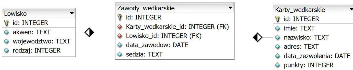
Obraz 1. Baza danych

Fragment bazy danych jest zgodny ze strukturą przedstawioną na obrazie 1. Tabela Zawody_wedkarskie jest połączona relacją z tabelą Lowisko (opisuje łowisko, gdzie będą się odbywać zawody) oraz tabelą Karty_wedkarskie (opisuje wędkarza, który wygrał zawody). Tabela Lowisko zawiera pole rodzaj, którego wartości oznaczają: 1 – morze, 2 – jezioro, 3 – rzeka, 4 – zalew, 5 – staw