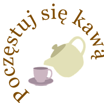
Obraz 1c. Obraz kawa