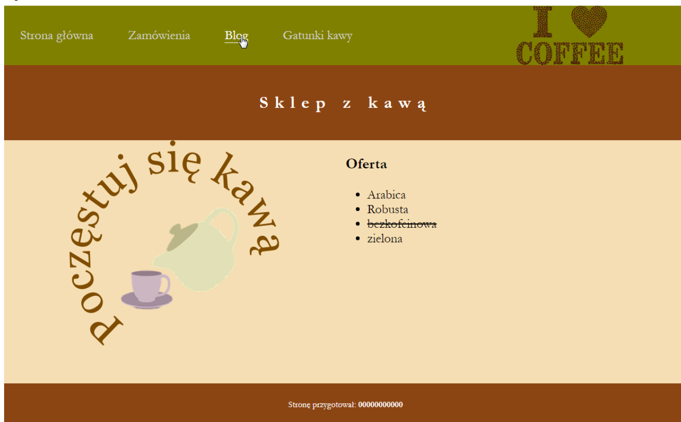
Obraz 2. Witryna internetowa, strona główna. Styl odnośnika Blog został zmieniony