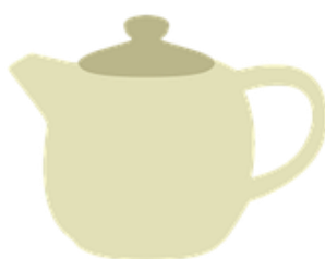
Obraz 1b. Imbryk