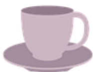
Obraz 1a. Filiżanka

Utworzony obraz należy zapisać jako kawa w formacie umożliwiającym zapisanie przezroczystości. Obraz kawa powinien mieć wysokość nie większą niż 400 px