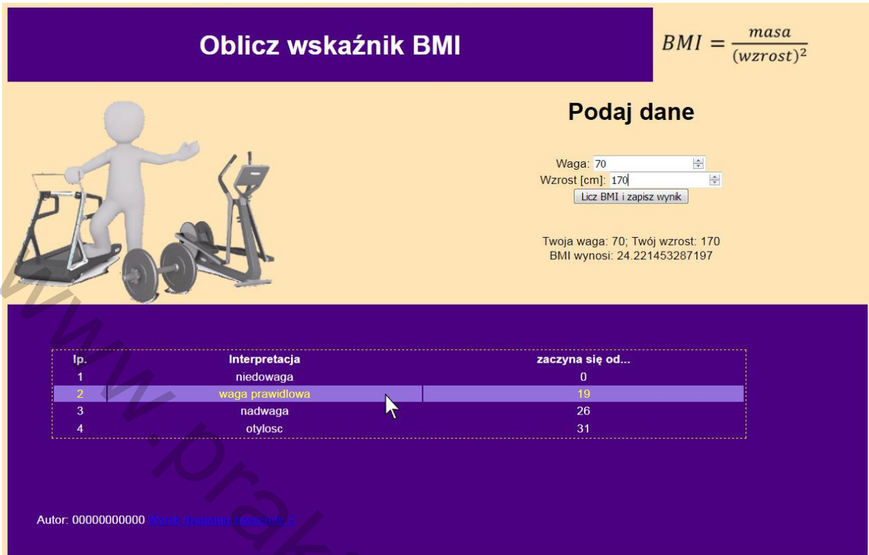
Obraz 2. Witryna internetowa, kursor na trzecim wierszu tabeli, zmienił się kolor tła i czcionki