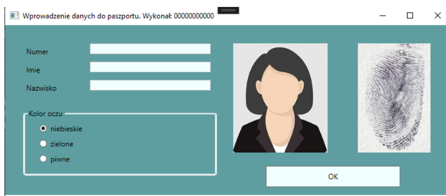
Obraz 1. Stan początkowy aplikacji

Za pomocą dostępnego na stanowisku egzaminacyjnym środowiska programistycznego wykonaj aplikację desktopową do wprowadzania danych paszportowych. Do wykonania zadania wykorzystaj znajdujące się na pulpicie archiwum 7-Zip o nazwie materialy.7z zabezpieczone hasłem: p@szporTy%