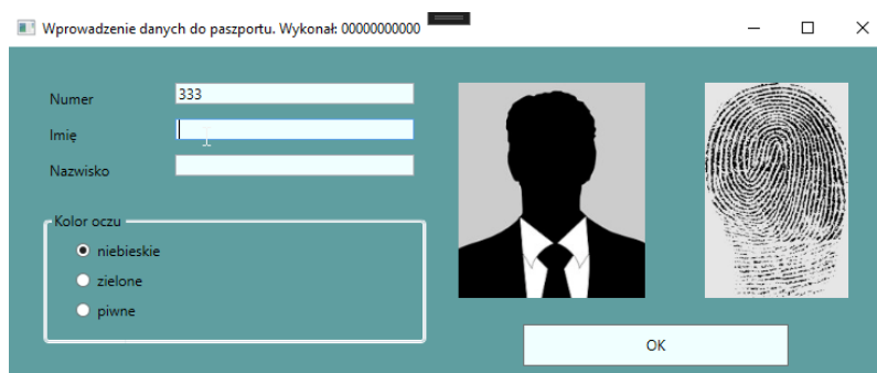
Obraz 3. Po opuszczeniu pola edycyjnego „Numer”

Na obrazie 1 przedstawiono ideę aplikacji desktopowej. W zależności od użytego środowiska programistycznego wygląd może nieznacznie się różnić.