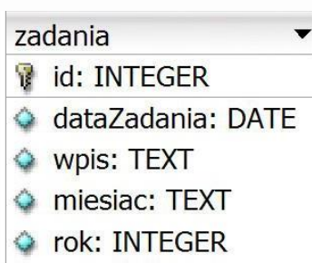
Obraz 1. Tabela zadania

Do wykonania zadania należy użyć tabeli zadania przedstawionej na Obrazie 1.