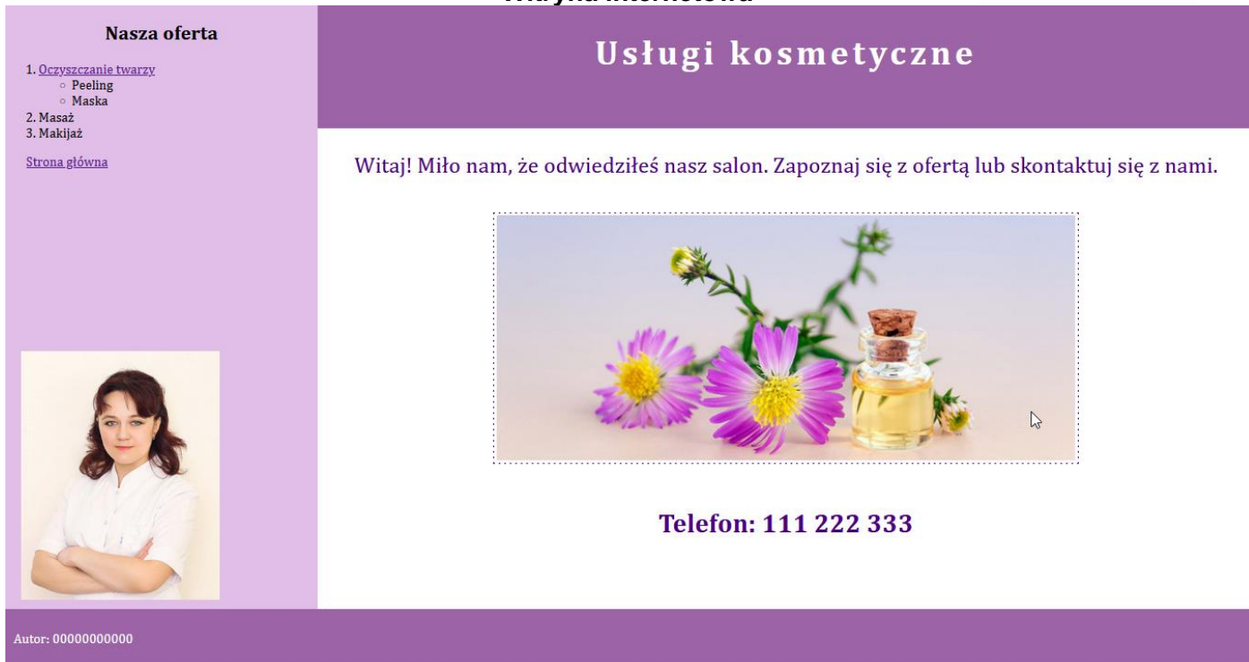
Obraz 2. Strona index.html , kursor znajduje się na obrazie po prawej stronie