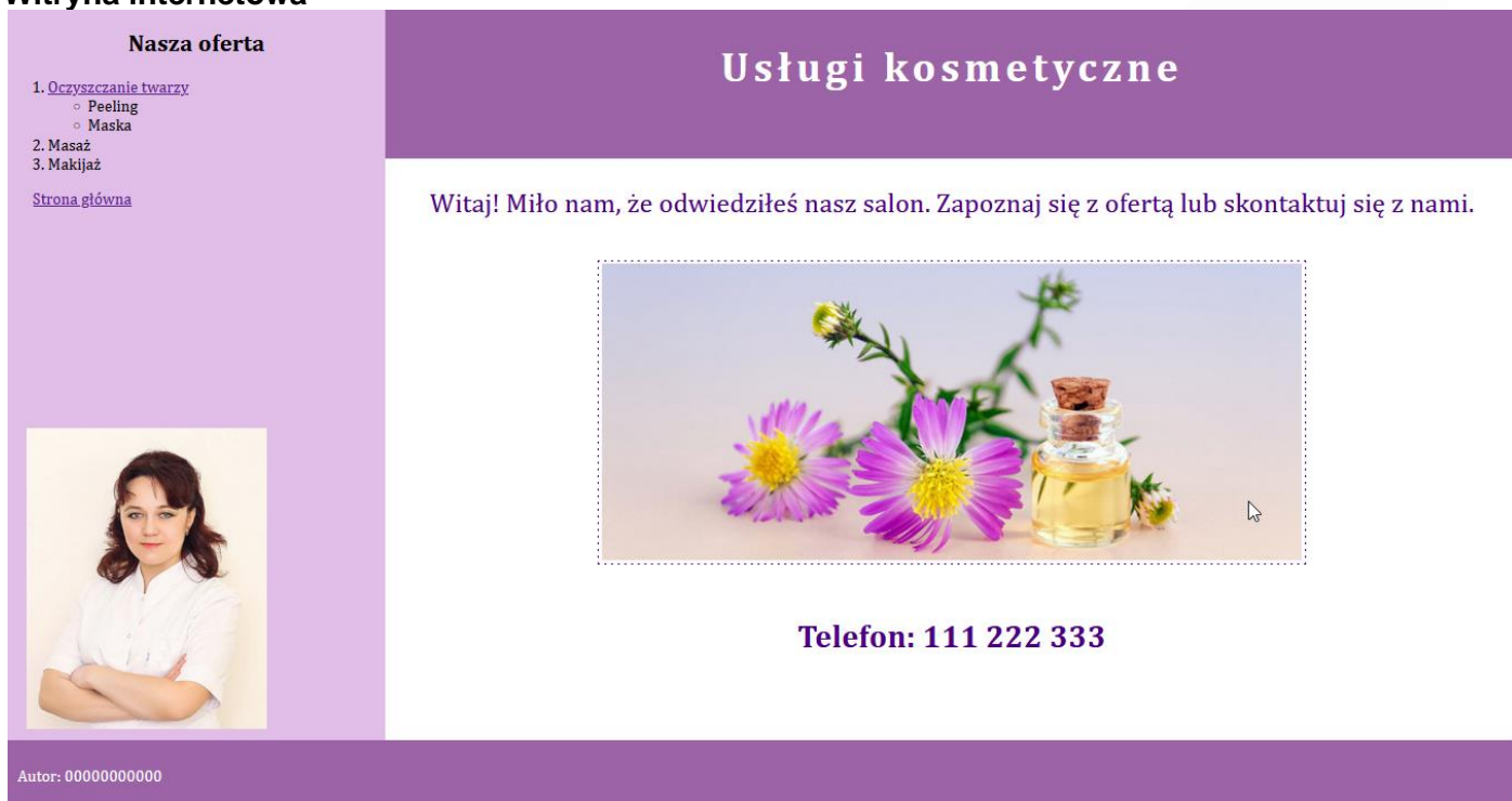
Obraz 2. Strona index.html , kursor znajduje się na obrazie po prawej stronie