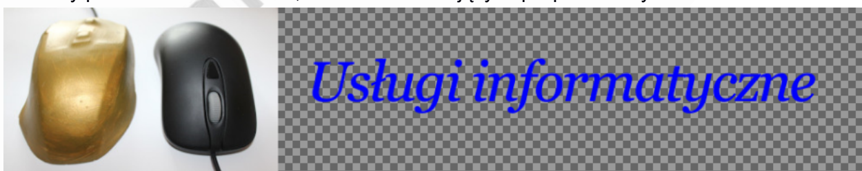
Obraz 2a. baner1