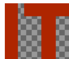
Obraz 1. Logo