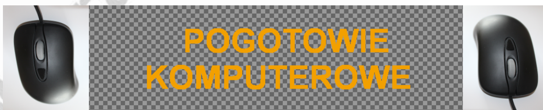
Obraz 2. Baner z przezroczystością – plik baner2