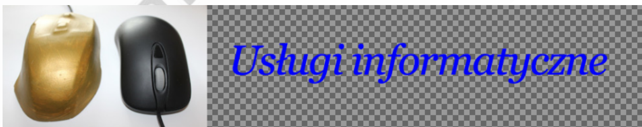
Obraz 2a. baner1