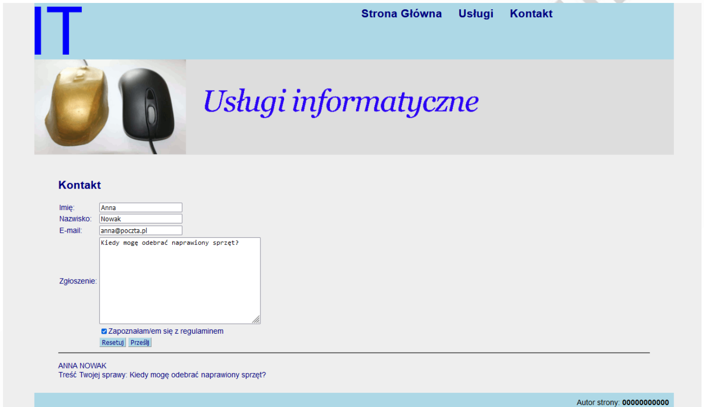
Obraz 3. Witryna, strona kontakt.html