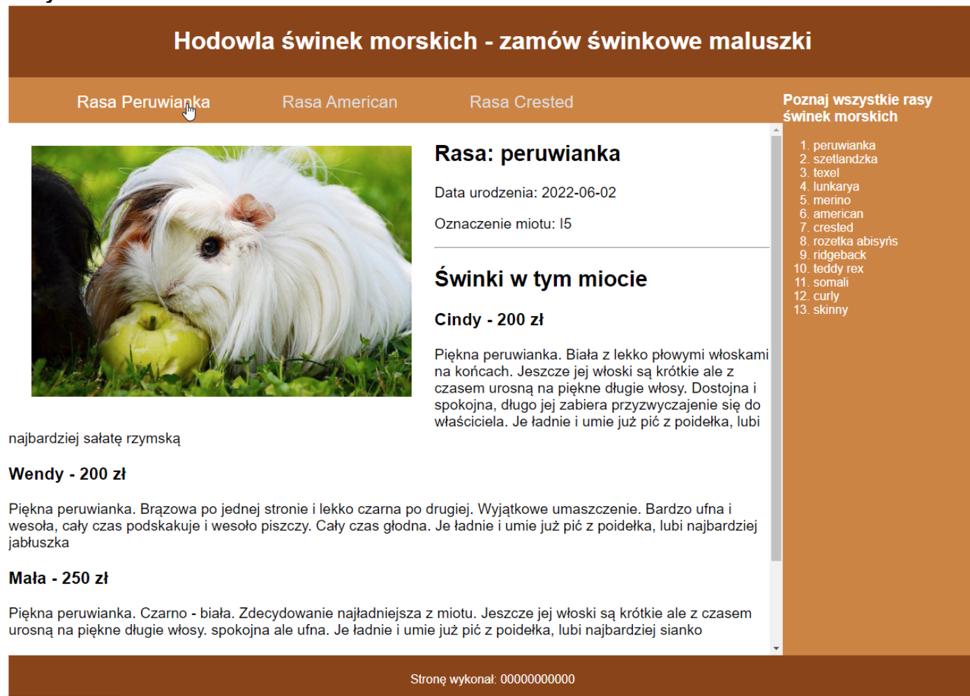
Obraz 2. Witryna internetowa. Kursor myszy na pierwszym odnośniku