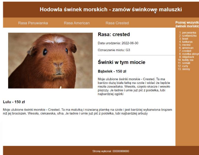
Obraz 5. Zmodyfikowany plik crested.php