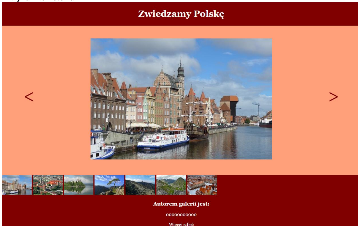
Obraz 2. Witryna internetowa.