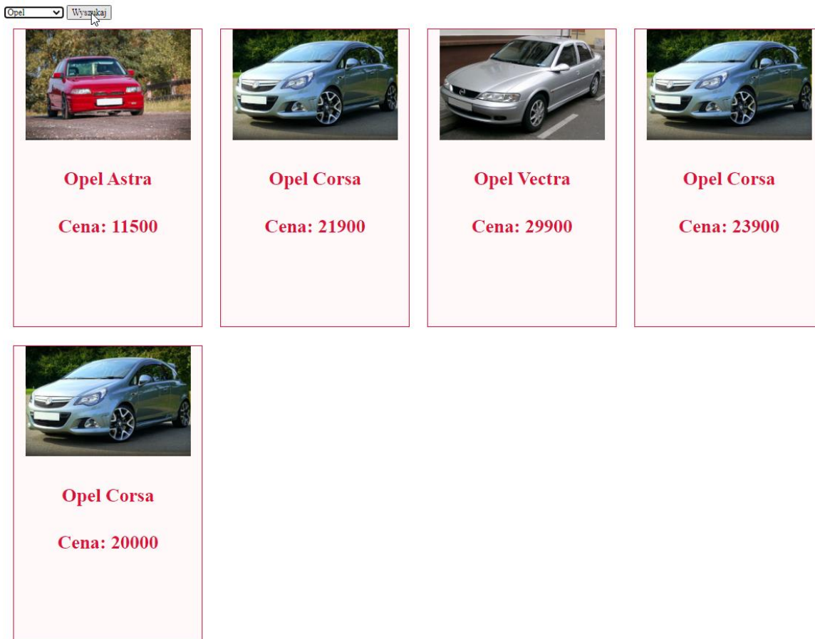
Obraz 3. Działanie skryptu 4 dla elementu „Opel” wybranego w liście rozwijalnej