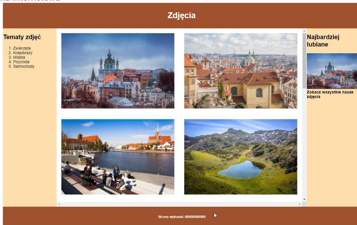
Obraz 2. Witryna internetowa